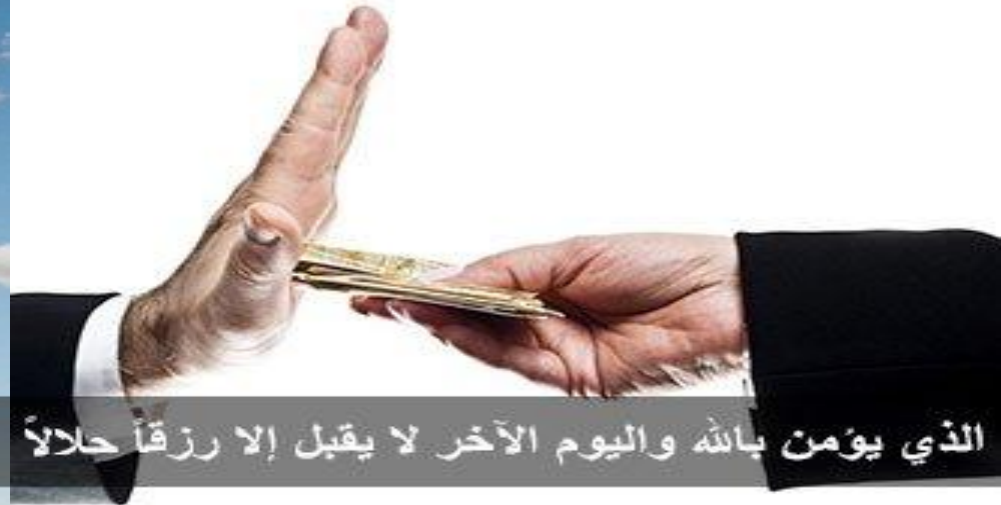
الذي يؤمن بالله واليوم الآخر لا يقبل إلا رزقاً حلالاً