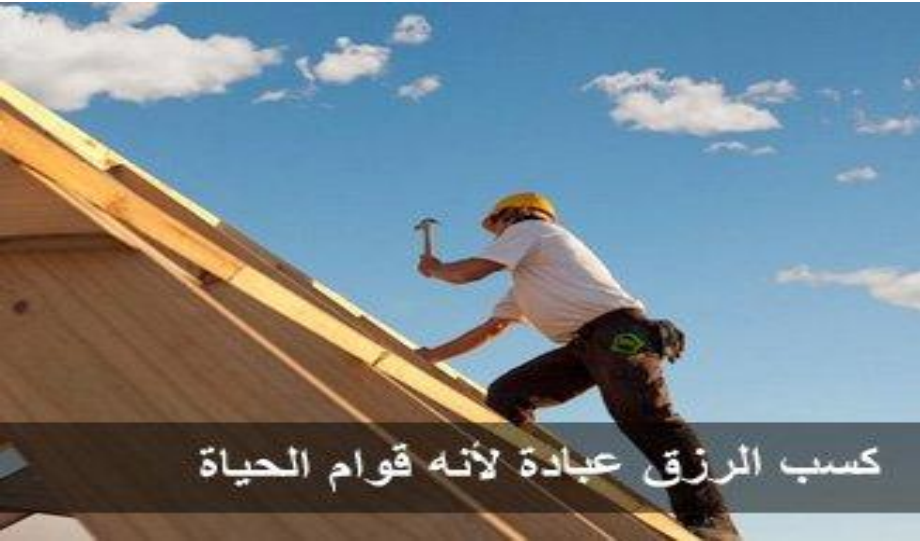
كسب الرزق عبادة لأنه قوام الحياة

1- الحث على الكسب المشروع قال تعالى : (( هو الذي جعل لكم الأرض ذلولا فامشوا في مناكبها وكلوا من رزقه وإليه النشور )) و اجتناب الكسب الحرام وتنمية المال بكل الوسائل المشروعة كالزراعة والتجارة.