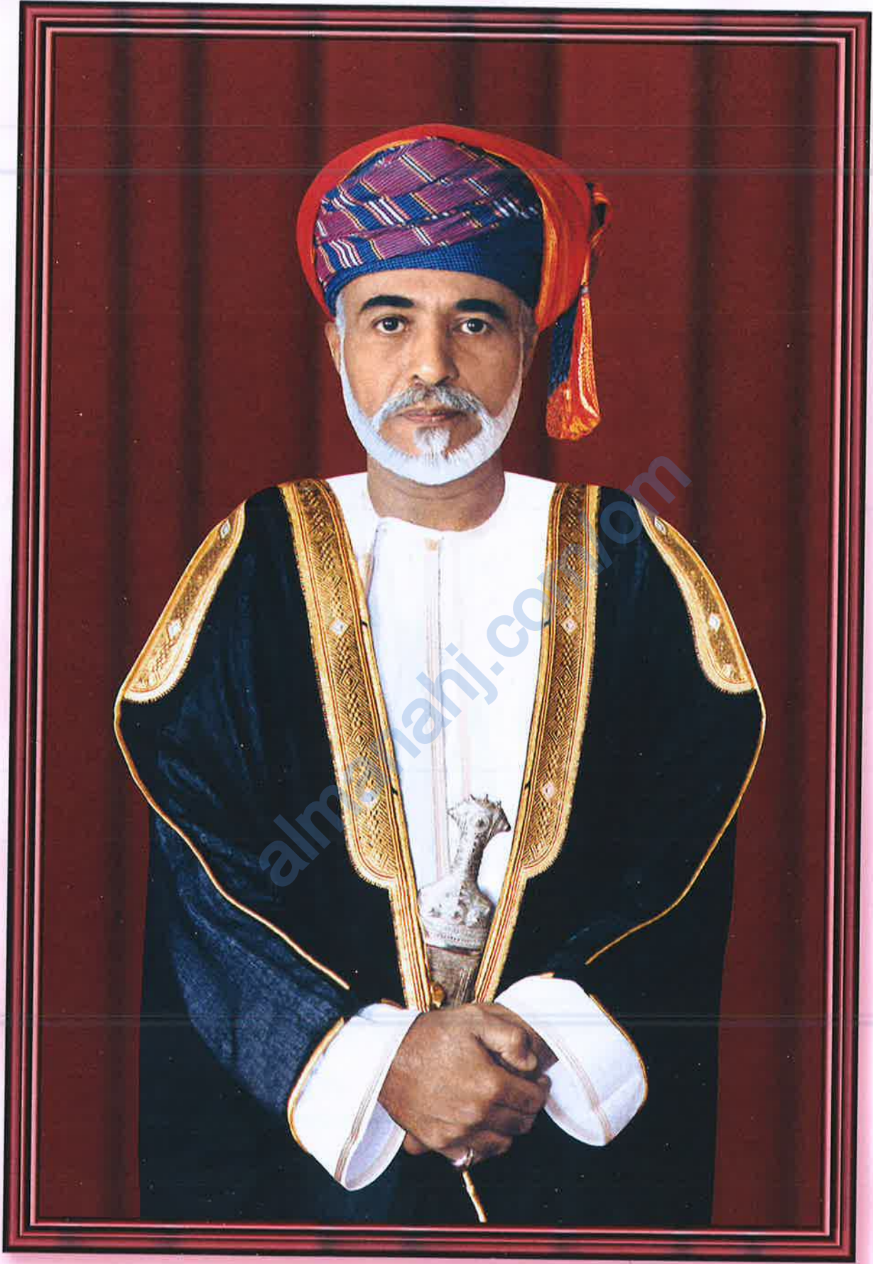
حضرة صاحب الجلالة استـطان فابوس بن سعيد المعظم