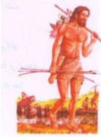
شكل (١) مرحلة الجمع والصيد

الافكار التي توصل اليها الانسان فظهرت الانظمة الاقتصادية والاداب والفنون