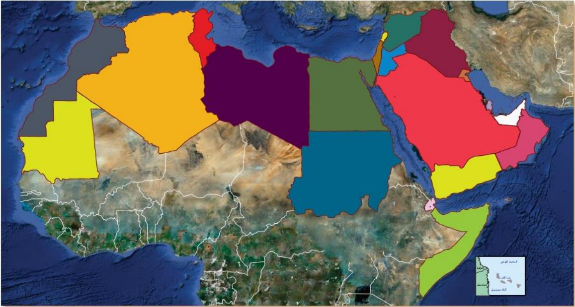
خريطة الوطن العربي الصّماء