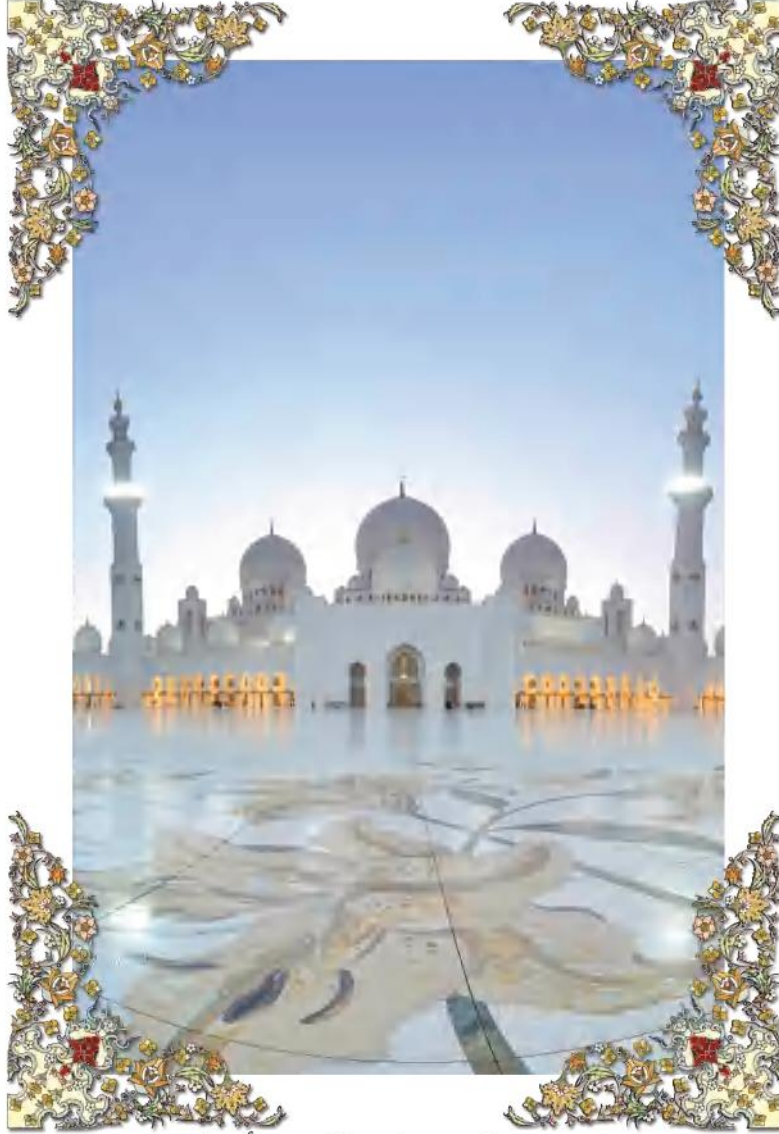
مسجد الشيخ زايد الكبير - أبوظبي

جميع الحقوق © محفوظة لوزارة التربية والتعليم بإعادة إصدار هذه الصفحة أو جزء منها أو تعديلها في نطاق السعادة المعرفية أو نقله بأي شكل من الأشكال من دون مسبق من الناشر.