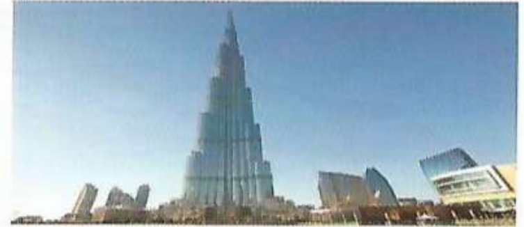
إنّه ناطحة سحاب