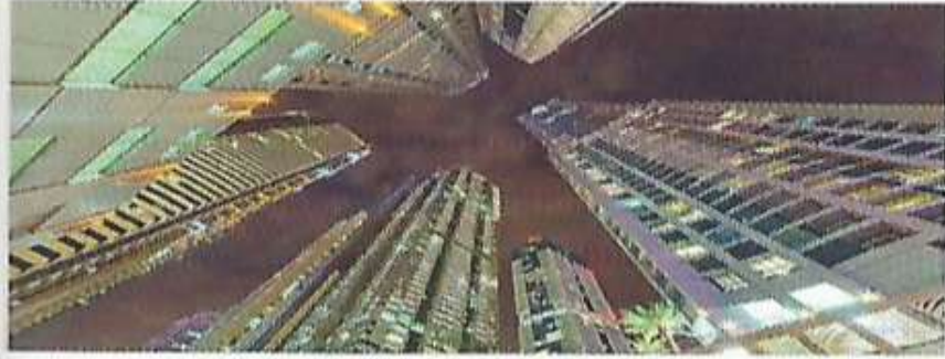
مُؤ مِعْمَارِيّ وَأَقْتِصَادِيّ