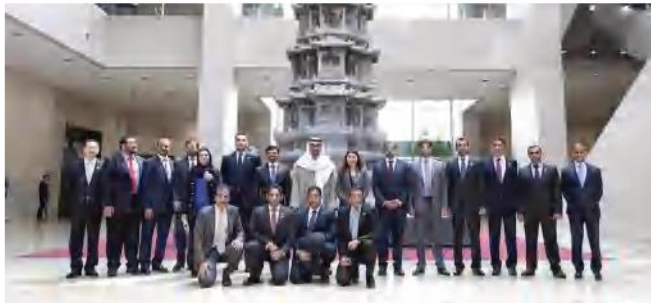
▷ زيارة صاحب السمو الشيخ محمد بن زايد -حفظه الله- لمتحف كوريا الوطني

• أستخلصُ القاسمَ المشتركَ بين جمهورية كوريا ودولة الإمارات العربية المتَّحدة.