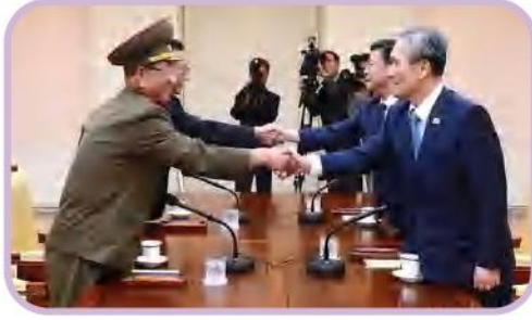
▷ لقاء بين مسؤولي الكوريتين

✧ تمّ التوصل إلى سلام دائم في عام 2000م.