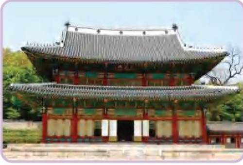
▷ قصر غيونغبوك في جمهورية كوريا

تعدُّ السياحة في جمهورية كوريا من القطاعات الحيوية، ويتردد السُّيَّاحُ إلى العديد من المناطق الهامة منها «سيؤول» العاصمة حيث تمزج ما بين الماضي والحاضر، وتتجسد فيها القصور التاريخية، بالإضافة إلى الآثار والبوابات القديمة، والمتاحف المهمة كالمتحف الوطني ومتحف سيؤول التاريخي، مع وجود مدن أخرى يقصدها السُّيَّاح كمدينة «كوانج جو»، و«بوسان»، إلى جانب جزيرة «شي جو» والتي تعد منطقة طبيعية جميلة جدًا، فالسياحة في جمهورية كوريا -كما في دولة الإمارات- تحتل أولوية من قبل الحكومة التي وفرت كافة المرافق والخدمات وكل ما يحتاج إليه السُّيَّاح.