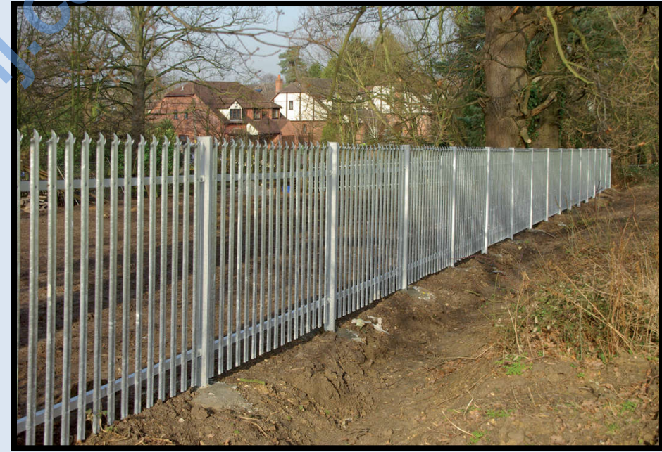
طبقة الخارصين الموجودة على هذا الحديد تحميه من الصدأ