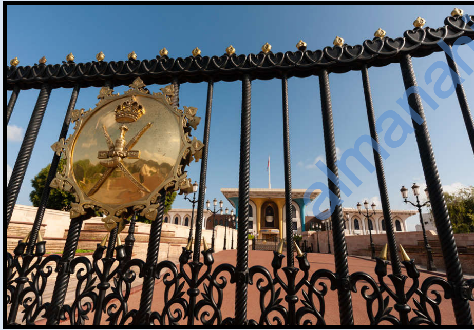
يعمل الطلاء الموجود على بوابة هذا القصر على حمايته من الصدأ