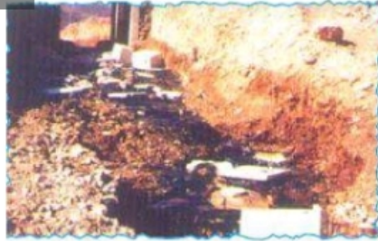
شكل (١٣) القهور البيئي في المجتمعات الفقيرة

ولا يقتصرُ التدهورُ البيئيُّ على المجتمعاتِ الفقيرةِ بل شملَ كذلك المجتمعاتِ المتقدمةِ ؛ حيثُ أنَّ أكبرَ مصدرٍ لتهديدِ البيئةِ البحريةِ يتركزُ في الدولِ الصناعيةِ ، في حينَ تشكلُ الدولُ الفقيرةُ تهديدًا للأراضي الزراعيةِ والحياةِ النباتيةِ الطبيعيةِ .