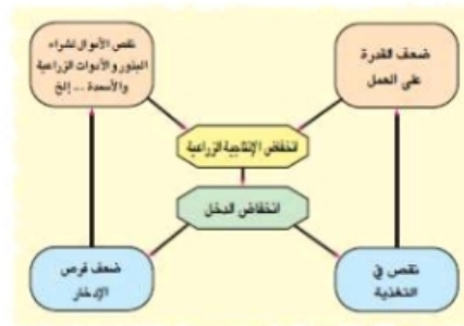
شكل (١٢) حلقة الفقر