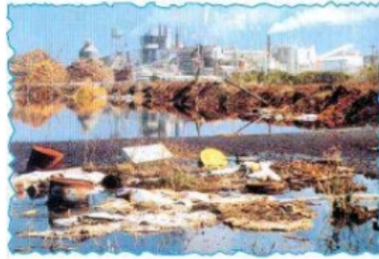
شكل (١٤) التلوث البيئي

أما التلوثُ فينتجُ عنِ ازديادِ النفاياتِ إلى حدِّ لا تمكنُ الطبيعةُ من تحليلها وامتصاصها .