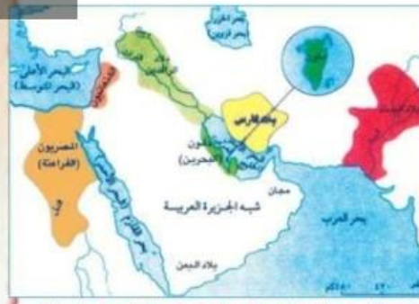
شكل (١٢) خريطة الحضارات القديمة في شبه الجزيرة العربية وما حولها

وتمثل دلمون مركزاً استراتيجياً مهماً . فهي حلقة الوصل بين بلدان الشرق الأوسط والأدنى ، حيث كانت في الشمال حضارة بلاد ما بين النهرين (العراق)، وفي الشرق حضارة (ميلوخا) في وادي السند (باكستان)، وفي مصر حضارة الفراعنة، وفي شبه الجزيرة العربية حضارة مجان في عمان، وحضارة اليمن .