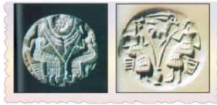
شكل (11) اَشْهُارِ دِلْمُونِيَّة

2- العثور على كثير من الاواني الفخارية المتنوعة ولاسيما في القبور كما عثر على اواني نحاسية وتمائيل مختلفة وانواع من العقود والخواتيم واختام كانت تستخدم للمهمات الرسمية. واشتهرت دلمون على مر التاريخ بانها الارض المباركة التي تنمو فيها الثمار وتكثر فيها المياه العذبة واصبحت في نظر سكانها بمثابة الموطن الطاهر فجعلوها موطناً يحرم فيه القتل ولا يشكر فيه احد من شيء يضايقه.