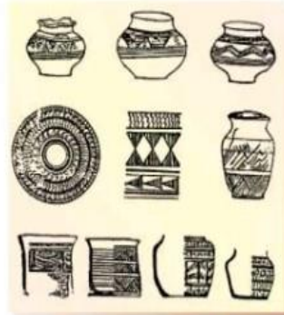
شكل (١٦) نماذج من فخار الخليج العربي

كانت هناك مناطق مزدهرة على شواطئ الخليج العربي الى الشرق من دلمون واكتشفت هذه المناطق في ام النار في دولة الامارات العربية المتحدة وتوضح انها كانت تعتمد في حياتها على التجارة البحرية. وتعد جزيرة ام النار من اهم هذه المواقع وقد تم العثور على العديد من المدافن والأواني الفخارية الحجرية والأسلحة وادوات الزينة ويضم ايضا ما يزيد علي خمسين مدفنا وينتمي فخار ام النار الى الالف الثالثة ق.م ويتميز هذا الفخار بتعدد الالوان والزخارف.