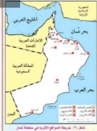
شكل (٩) خريطة الموقع الأثري في سلطنة عُمان