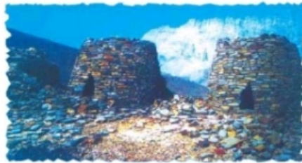
شكل (٩٠) مقابر من الألف الثالثة قبل الميلاد في بات

ومن خلال التنقيب والترميم الذي تقوم به وزارة التراث والثقافة لعز في جامع قلعة ولاية بهلاء، على (٢٧٠) فطعة فضية تعود إلى الألف الثالثة قبل الميلاد . وتؤكد هدم الأثار مع غيرها من المكتشفات الأثرية على أن الإنسان العماني يضرب جذوره عميقاً في الحضارة الإنسانية.