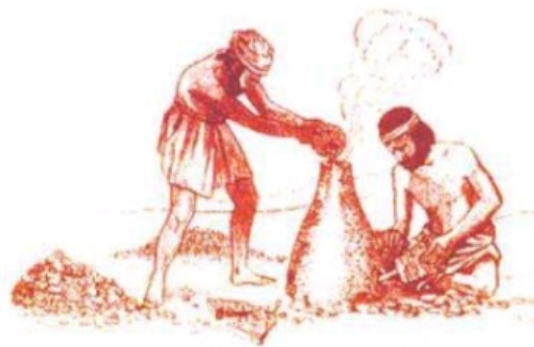
شكل (٨) صهر النحاس

- ووجدت في عمان انواع متعددة من كبريتات النحاس التي تحتاج الي مهارة فنية فائقة لصهرها وعثرت فرق التنقيب على العديد من المواقع الاثرية الدالة على استخراج النحاس وتصنيعه وبلغت 32 موقعا ومن اهم هذه المواقع: عرجا والاصيل والواسط. وعثرت على بقايا فضلات عمليات الصهر في تلك المواقع ويلاحظ ان الوقود المستخدم لهذا الغرض هو فحم الخشب الذي كان يجلب من مناطق اخري الي مواقع الصهر.