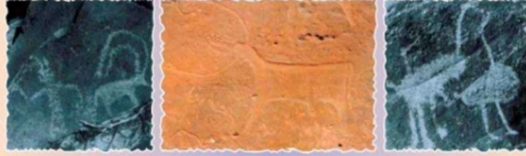
شكل (٧) الرسم على الصخور

- يعتبر توافر معدن النحاس على نطاق واسع في عمان القديمة عنصرا حضاريا مهما في تاريخها الحضاري فقد ظهرت صناعة الاسلحة والحلي وذلك بعد ان تمكن الانسان العماني في العصر الحجري الحديث من التوصل الي تقنية صهر النحاس فاصبح النحاس المادة الاساسية لصنع ادوات الانسان القديم.