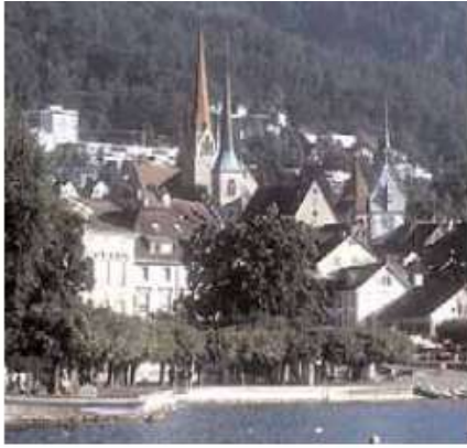
أنماط البناء ... ثقافة عالمية