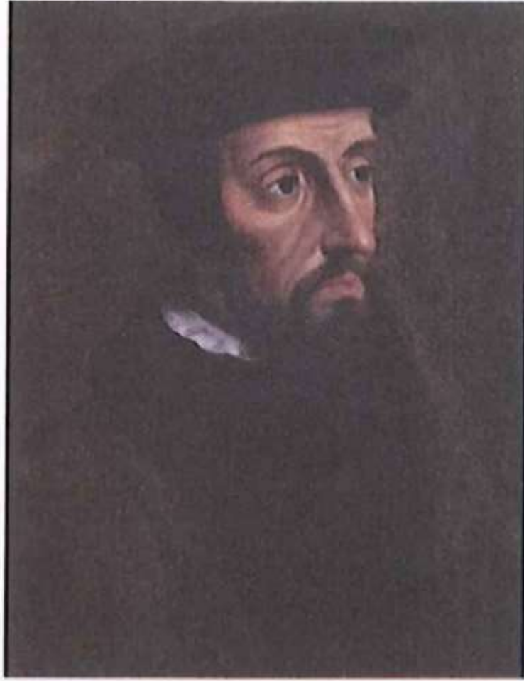
الشكل (٤-٨): جون كلفن.

ولمعرفة أهم المبادئ التي دعا إليها كلفن، تأمل الشكل (٤-٨)، ثم أجب عن السؤال التالي: