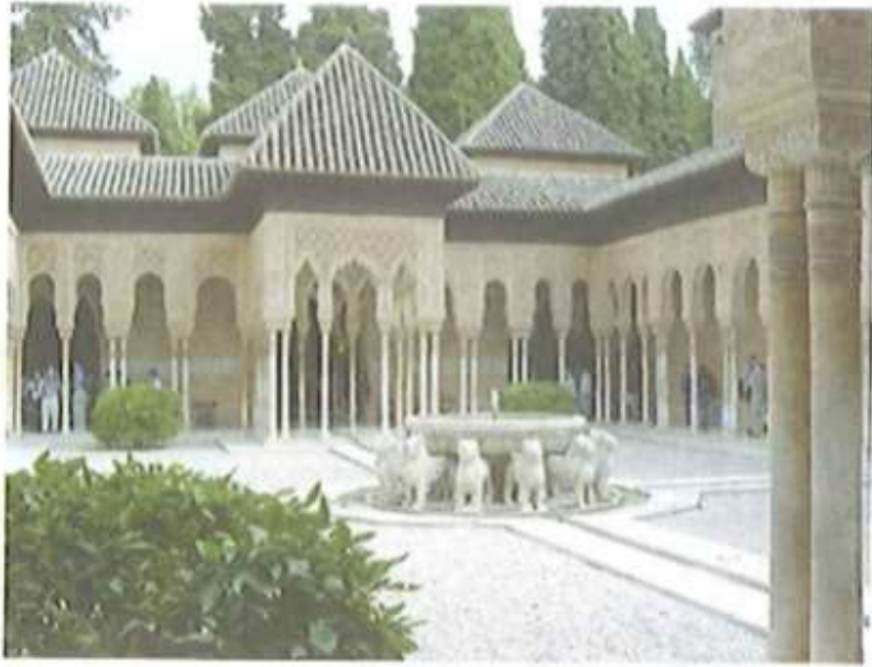
الشكل (٥-١٣): قصر الحمراء.

اهتم العرب بالزراعة في الأندلس، فأصلحوا وسائل الري ونظموها، وبنوا السدود وشقوا القنوات، وأقاموا الجسور والقناطر، واعتمدوا على الحيوانات في حراثة الأرض، وإعدادها للزراعة، وبرعوا في تنسيق الحدائق، فأدخلوا إلى الأندلس نباتات لم تكن معروفة سابقا كالأرز وقصب السكر والعنب والحمضيات والموز وغيرها . ومن الملاحظ أن مدينة بلنسية ما زالت تحتفظ بما تبقى من نظم العرب المتعلقة بسقاية البساتين، ومن أبرز الشواهد على تطور نظم الزراعة في الأندلس الحديقة الجميلة الملحقة بقصر الحمراء في غرناطة، فهي دليل واضح على عظمة العرب في الزراعة؛ لأنها أصبحت أنموذجا يحتذى في بناء الحدائق الغناء .