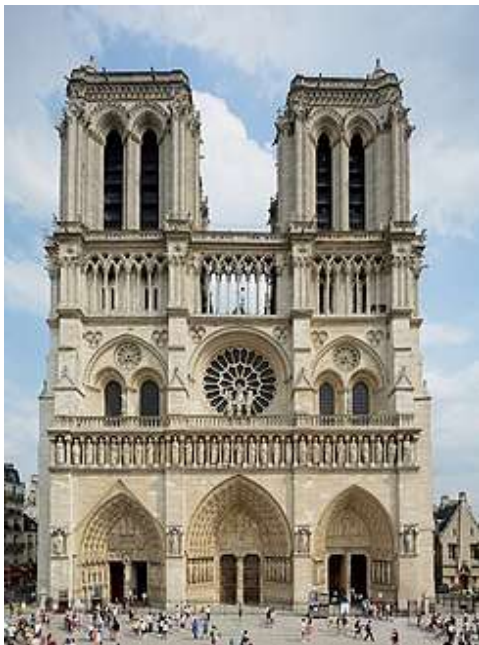
كاتدرائية نوتردام دي باريس وبرج إيفل / 1 من أروع التصميمات الفرنسية القديمة وقد زارها ٨ ملايين سائح سنويا