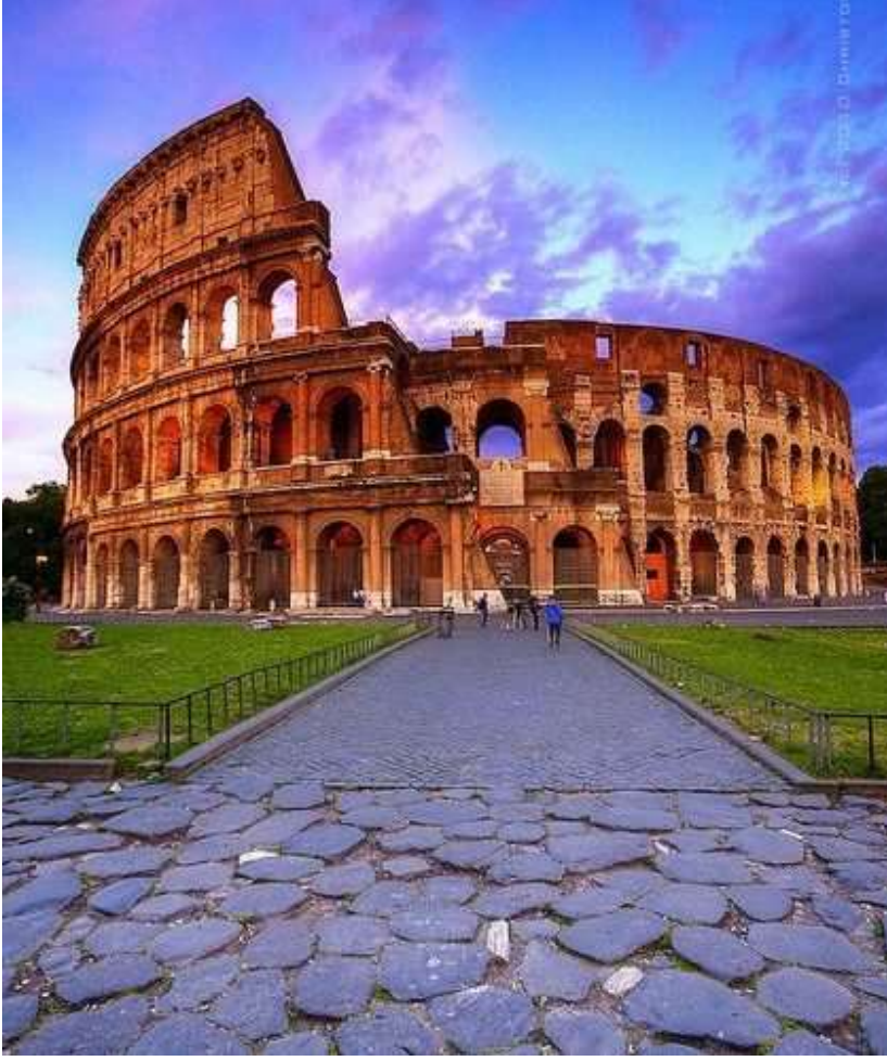
مبنى الكولوسيوم في / 4