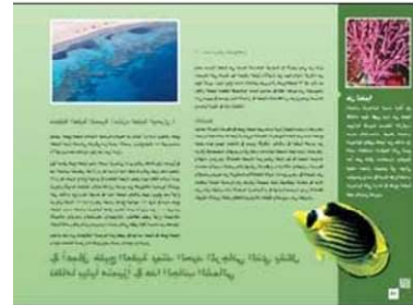
(ب) قبة لعتلار في مدينة البتراء.

أما المجموعة الثانية فقد أعدت منشور سياحي لمدينة العقبة تضمن نبذة