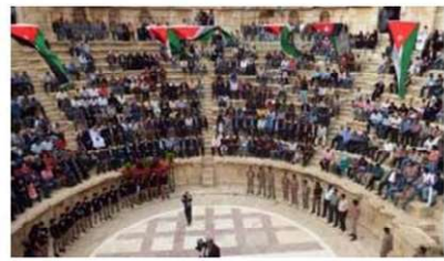
(ب) منظر من قبة لعتلار في مدينة البتراء.

أما المجموعة الثانية فقد أعدت منشور سياحي لمدينة العقبة تضمن نبذة