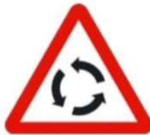
(ب) أمامك دوار.