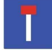
(أ) طريق غير نافذ.

3- شواخص المنع فهي عبارة عن لوحات معدنية دائرية الشكل، وبإطار أحمر، وأرضية بيضاء، والكتابة بداخلها غالباً سوداء، تتضمن معلومات عما يجب على مستخدم الطريق أن يمتنع عن فعله، وهذه بعض إشارات المنع: