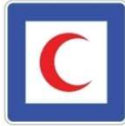
(ب) مركز إسعاف أولي.