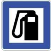
(ج) محطة وقود.

2- الشواخص الإرشادية وهي عبارة عن لوحات معدنية مستطيلة أو مربعة الشكل، والكتابة والرموز عليها بيضاء، علماً بأن الشواخص السياحية تكون بأرضية بنية والكتابة والرموز عليها بيضاء ومنها هذه الشواخص: