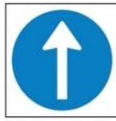
(ب) إتجاه إجباري للأمام.