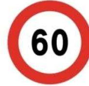
(أ) حدود السرعة القصوى (٦٠)

4- شواخص الأمر والإلزام هي لوحات معدنية دائرية أرضيتها زرقاء، والإشارات فيها غالباً بيضاء، تثبت على جوانب الطرق، تتضمن معلومات تلزم مستخدم الطريق ببعض الأوامر التي يجب التقيد بها، وهذه بعضها: