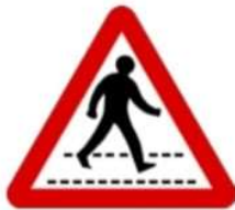
(ج) ممر للمشاة.

1- الشواخص التحذيرية هي عبارة عن لوحات معدنية غالباً، على شكل مثلث متساوي الأضلاع، رأسه للأعلى، إطاره أحمر، وأرضيته بيضاء، والكتابة والرموز داخله سوداء، توضع هذه الشواخص على جانبي الطريق؛ لتحذير السائق من مخاطر موجودة على الطرق