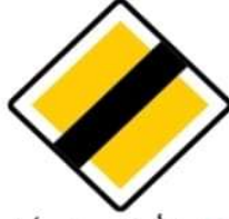
(ب) نهاية طريق ذي أولوية.