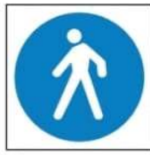
(ج) ممر إجباري للمشاة.

4- شواخص الأمر والإلزام هي لوحات معدنية دائرية أرضيتها زرقاء، والإشارات فيها غالباً بيضاء، تثبت على جوانب الطرق، تتضمن معلومات تلزم مستخدم الطريق ببعض الأوامر التي يجب التقيد بها، وهذه بعضها: