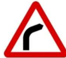
(أ) منعطف لليمين.