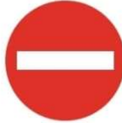
(ب) ممنوع المرور.