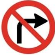
(ج) ممنوع الانعطاف إلى اليمين.

3- شواخص المنع فهي عبارة عن لوحات معدنية دائرية الشكل، وبإطار أحمر، وأرضية بيضاء، والكتابة بداخلها غالباً سوداء، تتضمن معلومات عما يجب على مستخدم الطريق أن يمتنع عن فعله، وهذه بعض إشارات المنع: