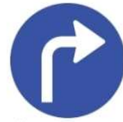
(أ) إتجاه إجباري لليمين.

5- شواخص الأولويات هي شواخص ذات أشكال وألوان متنوعة وجدت لترشد مستعملي الطريق إلى إعطاء الأولويات على التقاطعات ومداخل الطرق