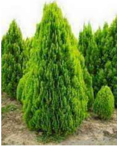
(1-2) الثويا الشكل

١. الأشجار الحرجية المخروطية : وهي أشجار تنتج بذوراً داخل مخاريط خشبية، وتكون أوراقها إبرية مثل الصنوبر، السرو، والثويا. انظر الشكل (٢-١)