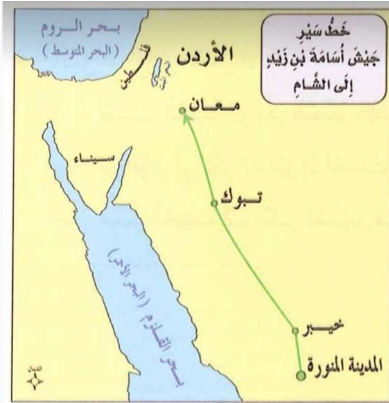
الشكل (٦-٢): خَطُّ سَيْرِ جَيْشِ أُسَامَةَ بْنِ زَيْدٍ.

أرسل الخليفة أبو بكر الصديق رضي الله عنه جيش أسامة بن زيد إلى بلاد الشام لقتال الروم فخرج الصديق يودع الجيش بنفسه وأوصى القائد أسامة بن زيد بمعاملة أهل البلاد معاملة حسنة وقد تمكن الجيش الإسلامي من تأمين الحدود وتحقيق الانتصار على الروم ثم عاد الجيش لينضم لجيوش المسلمين في قتال المرتدين