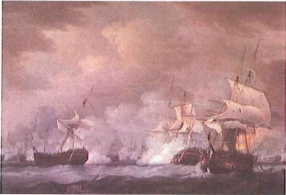
الشكل (٦-١٥): رسم توضيحي يُمثل معركة ذات السواري.