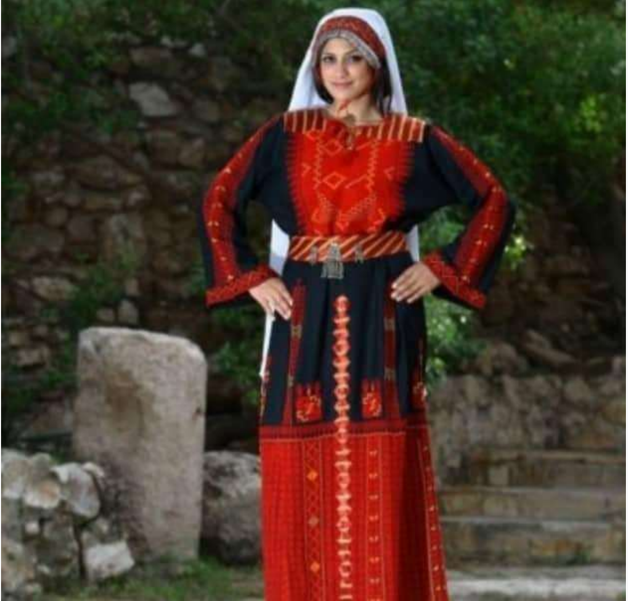
(1) صورة رقم