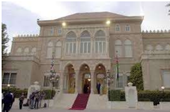
قصر رغدان العامر

عمّان : عاصمة المملكة الأردنية الهاشمية ، وهي مقرّ جلاله الملك ، وفيها المباني والوزارات المهمة . ومن أهم المعالم المعاصرة لمدينة عمّان الحديثة :