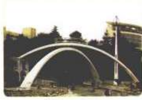
مدينة الحسين الطبية