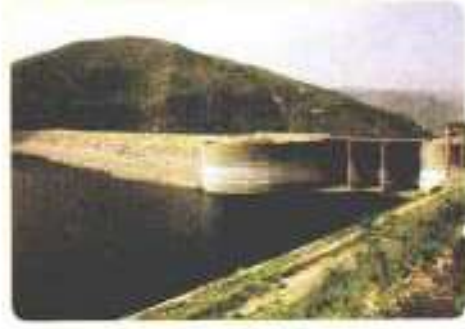
سد الملك طلال

منجزات حضارية في عهد الملك الحسين بن طلال :