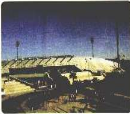
مدينة الحسين للشباب