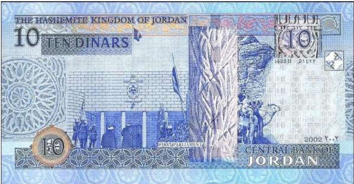
عَشْرَةَ دَنَانِيرَ 10 JD