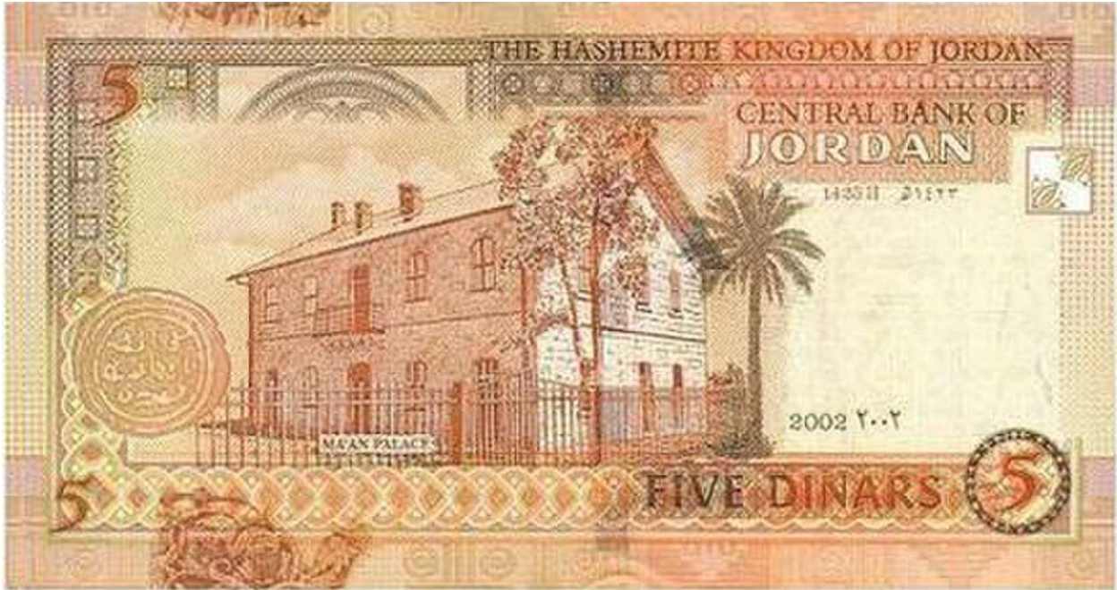
خَمْسَةَ دَنَانِيرَ 5 JD