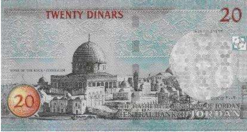
عشرون دينارًا JD 20