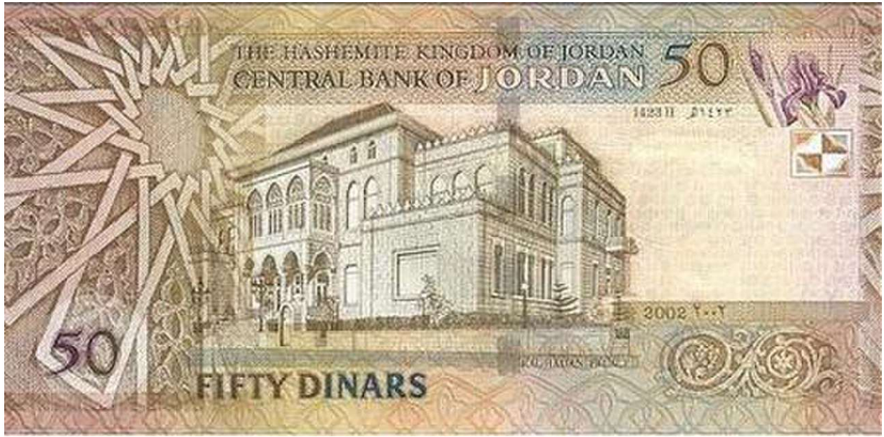
خمسون دينارًا JD 50

بِطَرَائِقَ مُخْتَلِفَةٍ JD 50 يُمَكِّنُنِي أَنْ أُمِثَّلَ الْ