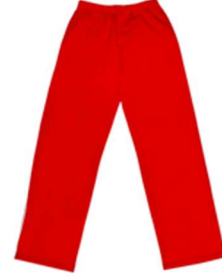
They are red trousers