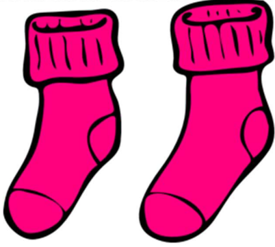
They are pink socks.