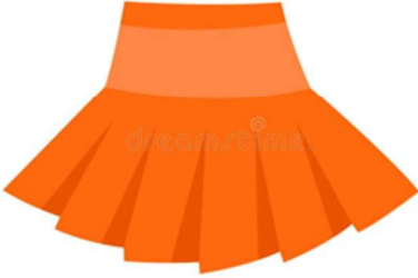
It's an orange skirt.