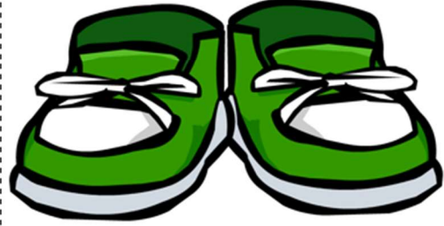
They are green shoes